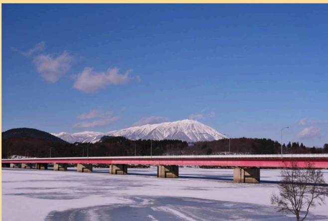
御所湖水結！岩手山と繋大橋(R4.1.10 南園地より)