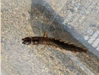
クロスジヘビトンボ幼虫