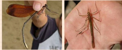
ミヤマカワトンボ成虫