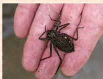
コオニヤンマ幼虫