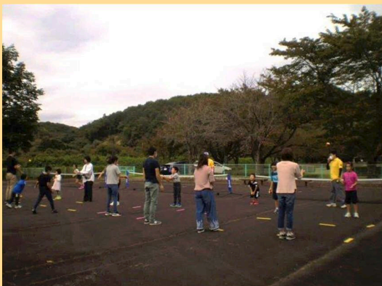
スポーツの秋 R2.10.10.ファミリーランド内レクリエーション広場で実施された「親子キッズテニス教室」の様子