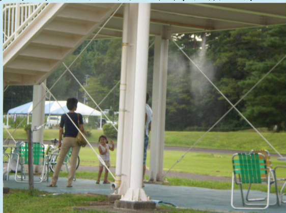
冷たいミストで一休み(H28.8.14 乗り物広場スワンサイクルホーム下)