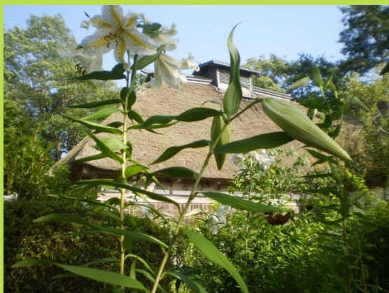
山百合と蝉のぬけがらと茅葺屋根 (H30.7.20.さくら園 曲り家)