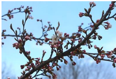
本格的なお花見はまだ先かな？