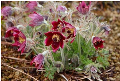
花丘のオキナグサ