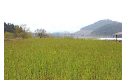
ようやく咲き始めました！