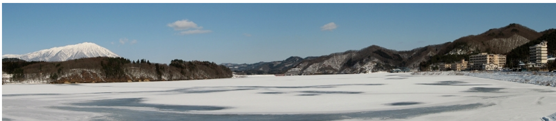
繫大橋から御所ダム堰堤を望む

さて、今日(1/21)は久々に岩手山がきれいに顔を出しましたので、湖面ウォッチングをしてきました。