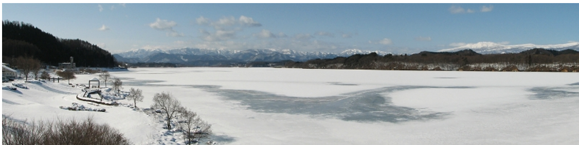
繫大橋から上流部を望む