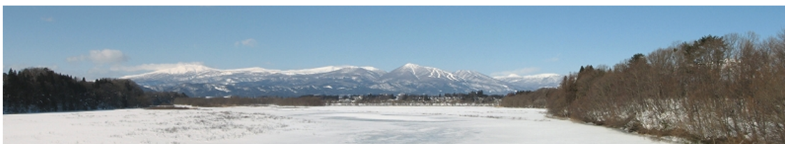
安庭橋から下久保湿地～駒ヶ岳を望む