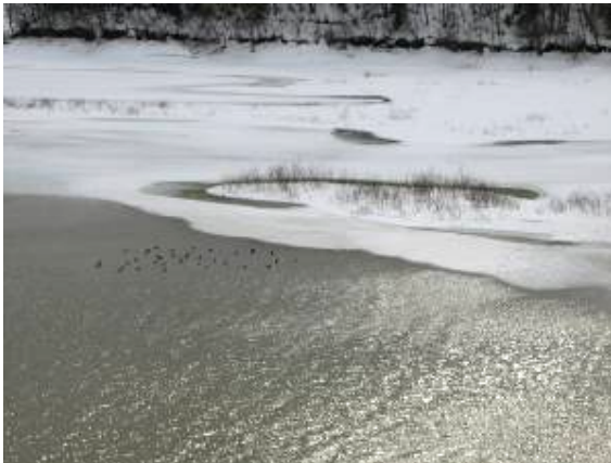
湖面には水鳥の姿が...

2月末にも真冬が続き、2月の日最高気温が - 0.3 と平年より2も低くなっていました。寒かったはずですね！しかし、3月になり最高気温は+が続いています。御所湖の湖面の氷も一気に融けはじめました。公園内は依然と雪景色ですが、周遊する道路には雪はありません。時々、様子を見に来ているのか、白鳥の姿も見かけます。