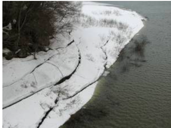
湖岸や湖面の春の兆し！