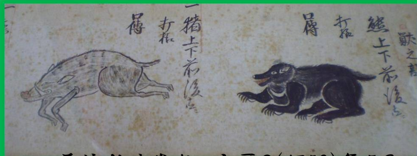
原流鉄砲巻物 宝暦8(1758)年5月