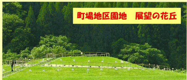
町場地区園地 展望の花丘

《お問い合わせ窓口》 社団法人深沢紅子野の花美術館 住所 〒020-0885 岩手県盛岡市紺屋町4-8 TEL 019(625)6541 (受付時間AM:10:00~PM:5:00)