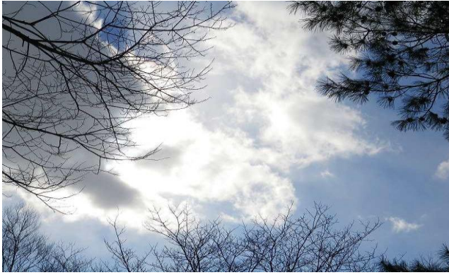
深呼吸して 見上げると彩雲が...

無風快晴、気温は氷点下、トレールウォークに最適な日を迎えました。しかし、参加者がありません。スタッフ研修と、言うことで催行しました。